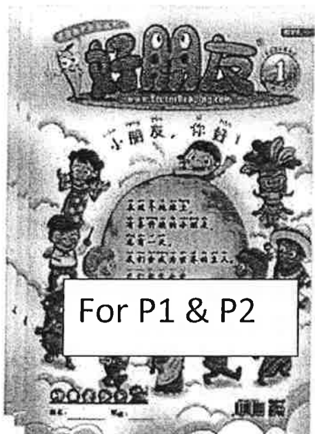
For P1 & P2