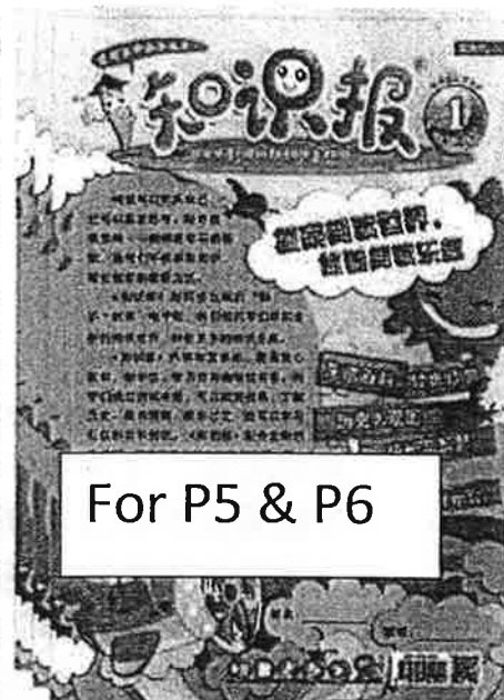
For P5 & P6