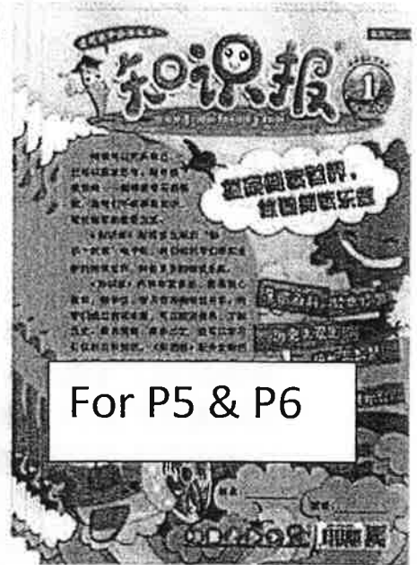
For P5 & P6