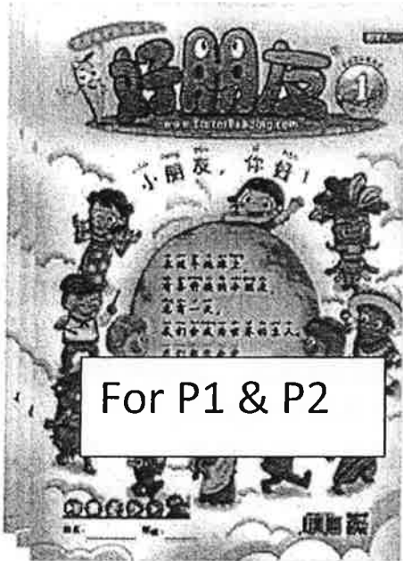
For P1 & P2