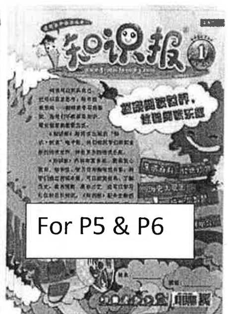
For P5 & P6